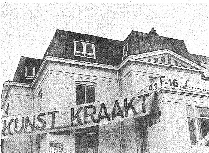
Kunstenaars kraken spekulatie-pand.

Aktie voeren kost veel geld! De BBK beschikt helaas niet over veel geld. De aktie moet echter doorgaan. Daarom wijzen wij u graag op het gironummer van de BBK: 583458. En danken u bij voorbaat voor uw bijdrage. 583458/583458/583458/583458/583458